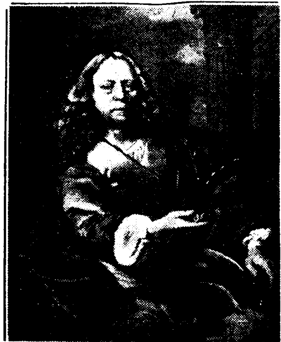
Artus Quellien, de oude.

Het was echter niet alleen de godin Fortuna, die den beeldhouwer naar de Amstelboorden dreef, het was ook wel degelijk de uitnodiging der Burgemeesteren van de stad, die Quellien vereerden met de grootsche opdracht om hun nieuw stadhuis te versieren. Dit besluit was hoogstwaarschijnlijk genomen op voorstel van Jacob van Campen, den genialen bouwmeester, wiens ontwerp in Januari 1647 was aangenomen, en die een groot bewonderaer was van Rubens en de Antwerpsche barok-school. Hij koos zijn medewerkers meest uit Antwerpen en het was dus geen wonder dat hij voor het beeldwerk den beroemden Quellien verkoos. In Juli 1647 logeerde deze ten huize van den schilder Asselyn te Amsterdam: in 1650 kwam hij zich te Amsterdam vestigen, waar hij tot 1664 woen bleef. Hij genoot er alle privilegiën „die men ergen soude comen desireeren”, en kreeg er bovendien een tegemoetkoming van 600 gulden 's jaars in zijn woonkosten. Zijn broer Hubertus volgde hem en estte alle beelden, die door Artus vervaardigd zijn. Zij werden gezamenlijk uitge-