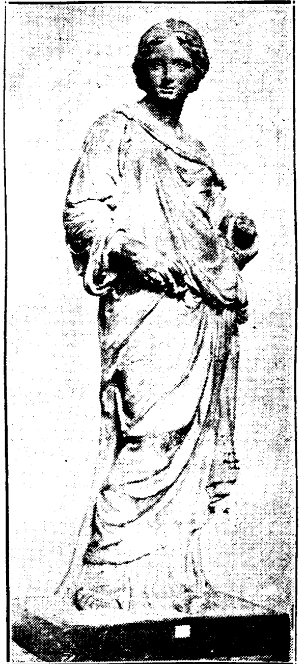
„De Gerechtigheid”. (Door Artus Quellien).

In de hoofdstad van Holland had Artus Quellien zijn geboorteplaats niet vergeten. In 1658 vervaardigde hij voor haar Sint Andriëkerk het prachtige beeld van Sint Pieter, den Apostel met de sluetels van het hemelrijk, en met het groote berouw. Ook had hij zijn verdiende penningen belegd in onroerende goederen aan de Schelde. Reeds bezat hij in de Cammerstraat te Antwerpen het huis, genaamd „Het schild van Bourgoigne”. In 1658 kocht hij daar nog bij „eene huysinge van plaisantie, metter optrekende brugge”, liggende te Hoboken „ter drie sijden int water” en voorts nog een buitengoed, eveneens in de baronie van Hoboken gelegen. Nu zijn taak in Amsterdam volbracht was, keerde hij met roem beladen terug om van dit bezit te genieten. De Staten hadden hem voor zijn vertrek nog „om den hals een keten fijn van goudt gehangen tot belooning”, verhaalt ons Cornelis de Bic. In Antwerpen werd hij onmiddellijk lid der pas gestichtte Akademie, opgericht om het verval van de Vlaamsche kunstschool tegen te houden. Waarschijnlijk trok hij zich spoedig na zijn aankomst terug op een zijner „huizingen